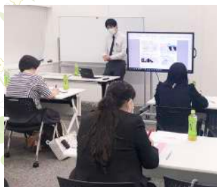
研修ルーム・商品研修