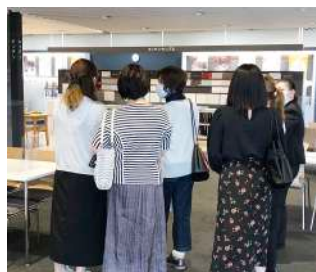
ショールーム・商品説明